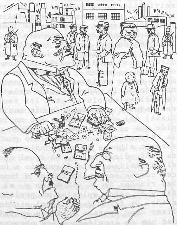
Ellos os darán empleo

No se trata en este artículo, de dar una definición de la crisis de sobreproducción (en realidad de subconsumo) puesto que repetiríamos lo ya escrito por Marx. Pero si queremos tratar el problema de la lucha de clases hoy en día y del papel del paro obrero. Para entender mejor nuestro propósito, es menester emplazar la situación actual en su contexto histórico, es decir, que en vez de examinar con lupa las curvas de crecimiento, de productividad, etc., nos parece más pertinente y más justo partir de las paradojas que terminan, todavía más hoy que ayer, la tradición principal del capitalismo mundial: el antagonismo entre el capital y el trabajo. Nuestra principal base económica para estimar la situación política mundial no son las dificultades del capitalismo, ni el paro obrero, ni las perspectivas de reajuste técnico, menos aún la pretendida "crisis de sobreproducción". Todo eso sería economismo, es decir, maneras de plegarse a la lógica y a la contaminación cerebral que nos quiere imponer el capitalismo. Nuestra base económica es mucho más amplia, la única compatible con la concepción materialista y dialéctica de la historia. El capitalismo como sistema social , independientemente del funcionamiento intrínseco de su economía (crecimiento, reconversión o crisis) ha creado con creces las condiciones necesarias para ser arrasado por la clase pro-