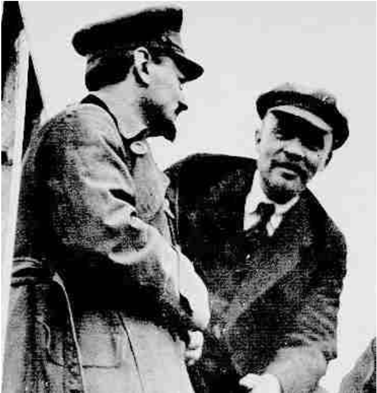
Trotsky y Lenin

por ejemplo: “Lenin fue detenido en Leningrado”? Está claro que en Leningrado no se habría podido detener a Lenin. Sería aún más extraño decir: Pedro fundó Leningrado. Quizás, con el paso de los años, de décadas, el nuevo nombre de la ciudad, como en general todos los nombres propios, pierda su carácter de recuerdo histórico vivo. Pero en este momento sentimos con demasiada claridad que Petrogrado no es Leningrado más que desde el 21 de enero de 1924 y que ese nombre no podía haberse adoptado antes. Por eso, en mis recuerdos, conservo para Leningrado la denominación que se utilizaba en la época que describo.