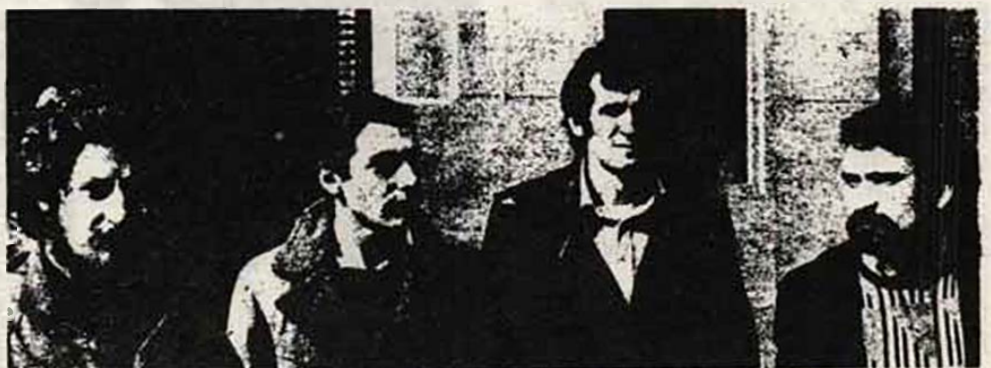
Representantes de la Liga Comunista abandonan el Ministerio de la Gobernación después de haber presentado la documentación correspondiente para su legalización.

Si este gobierno es antidemocrático, no se puede negociar con él la libertad. Desde hace más de dos