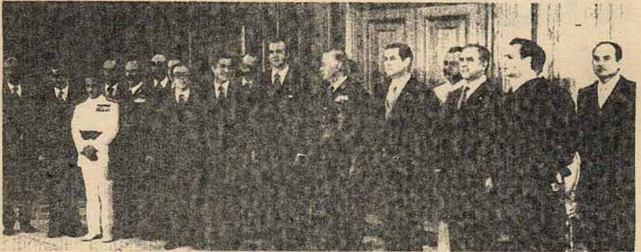
EL REY CON SU PRIMER GOBIERNO

Publicamos una síntesis, hecha por el comité de redacción, de la Resolución política aprobada por el III Congreso.