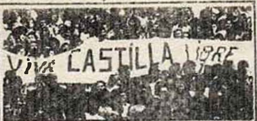
RECITAL DE LOS PUEBLOS IBERICOS