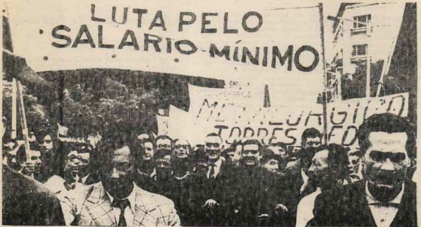
Manifestación del 1º de Mayo en Lisboa

tas de un sindicalismo respetuoso de sus normas: « subordinado al Estado burgués. Sin embargo, aunque no se contrapongan conscientemente al orden de los capitalistas que ahora representa Spínola, los pasos en la movilización independiente y la autoorganización son importantes. La puesta en pie de sindicatos como ese Intersindical que agrupa a más de 1.000.000 de trabajadores, el recurso generalizado a la huelga, la confraternización de la tropa con el proletariado y el pueblo, la solidaridad a flor de piel entre los más diversos sectores oprimidos tienen ya un carácter de clase inaceptable para la Junta. Esta aparenta dirigir lo que no controla y pronto empieza a hablar de manifestaciones de « caos y anarquía » reconociendo que las masas se están saliendo peligrosamente de su « orden ». En particular, la oleada huelguística marca una clara división, y las huelgas de hambre y enfrentamientos entre tropa y oficiales inquietan a la burguesía. « Con la primera huelga a escala nacional — superando la dispersión de los primeros momentos — que es la de Correos y Comunicaciones, las ilusiones ingenuas empiezan a hundirse: la Junta da orden al Ejército de estar dispuesto a intervenir contra los trabajadores. »