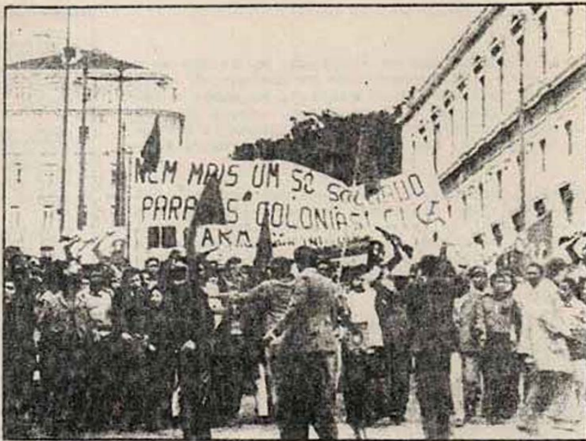
Manifestacion de trabajadores africanos inmigrados

ción de los fines de los capitalistas(...) la confianza en los capitalistas", Lenin planteaba la "ruptura con los capitalistas, la desconfianza hacia ellos, el poner freno a su vil codicia y terminar con sus ganancias... la confianza en las clases oprimidas y, sobre todo, en los obreros de todos los países".