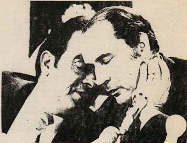
MM. GEORGES MARCHAIS FRANÇOIS MITTERRAND.

¿Qué derecho tiene ningún portugués a discutir decidir la suerte de los pueblos africanos de Angola, Mozambique y Guinea-Bissau?