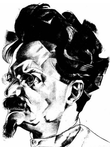
TROTSKY, por G. Amendo.