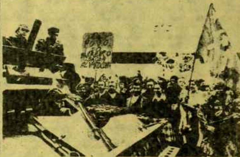
"Batalla por la producción" o "batalla por el poder"?

El PC obtuvo un resultado electoral que no traduce exactamente su capacidad de movilización y su fuerza organizativa. Electoralmente, el PC paga el precio de su política de colaboración de clases que lo condujo, tanto a traicionar más o menos abiertamente numerosas luchas como a subordinar todas las posibilidades de unificación de la clase obrera en la lucha anticapitalista a la posibilidad de jugar un papel de presión sobre el aparato de Estado; el hecho de que la extrema izquierda y los centristas hayan ganado un tercio de los sufragios del PCP indica la amplitud de sus pérdidas sobre su izquierda.