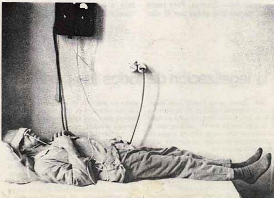
sesión de electroshock en un sanatorio psiquiátrico soviético