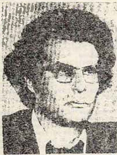
Alain Krivine, dirigente de la LIGUE COMMUNISTE

que pretendiese reconstruir la Ligue con otra apariencia sería arrestado inmediatamente. Eso es la intención del gobierno.