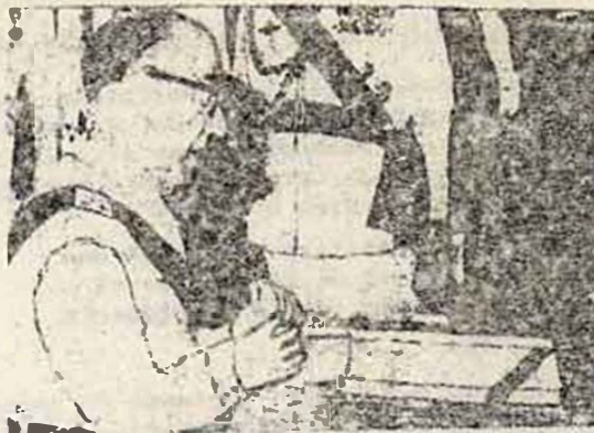
Carrero juró el cargo.

Carrero continue la agravación de la crisis del franquismo.