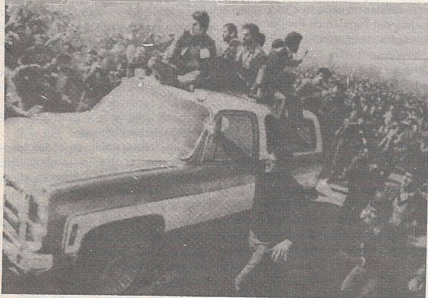
Millares de personas siguieron los coches que transportaban al "ayatollah" y a sus colaboradores cercanos.

Frente a esta conspiración traidora que se prepara a asfixiar la revolución, sólo los obreros, los trabajadores, los campesinos los soldados pueden defenderla. Para ello es indispensable desarrollar su organización: los sindicatos, los comités de fábrica, las asambleas populares, las asambleas y comités de soldados. Conservar las armas y defender las milicias como auténticos garantes del orden revolucionario. Centralizar esas fuerzas. Levantar la bandera de la Constituyente y la independencia nacional, de un gobierno revolucionario de los obreros y campesinos.