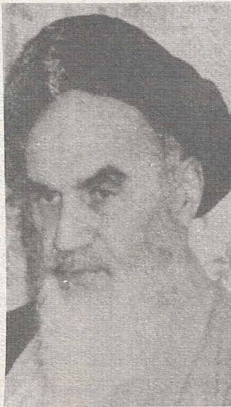
El ayatollah Jomeini