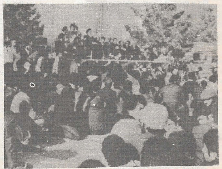
Jomeini pronunció su primer discurso en Irán en un cementerio.