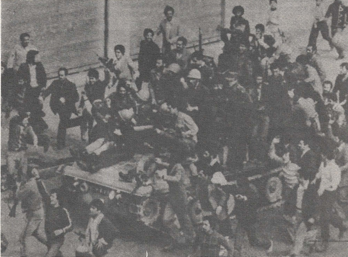
Los insurgentes lograron apoderarse de muchos tanques.

Sin embargo, ahí está Jumeini subido al carro, habiéndose puesto hábilmente a la cabeza del movimiento revolucionario. ¿Para qué?